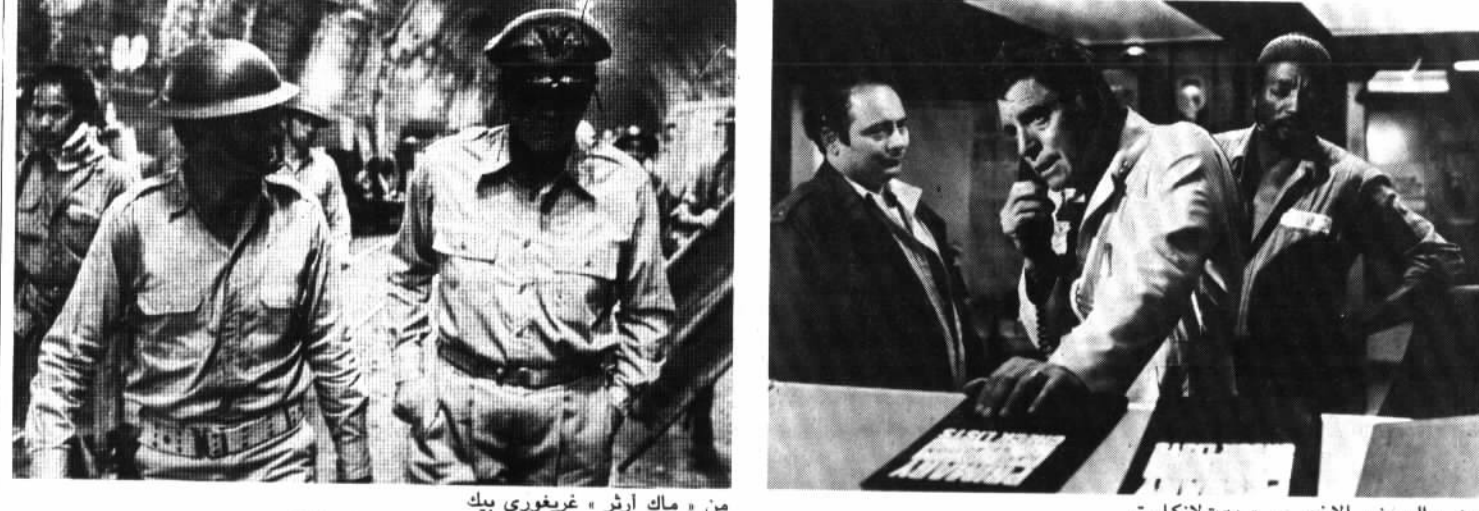
من امك ارثر غريغوري بيك (يمين) والوزير الاخير... بيرت لانكاستر